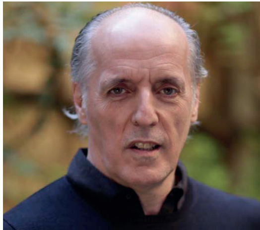
ALEJANDRO AMOR Defensor del Pueblo de la Ciudad Autónoma de Buenos Aires